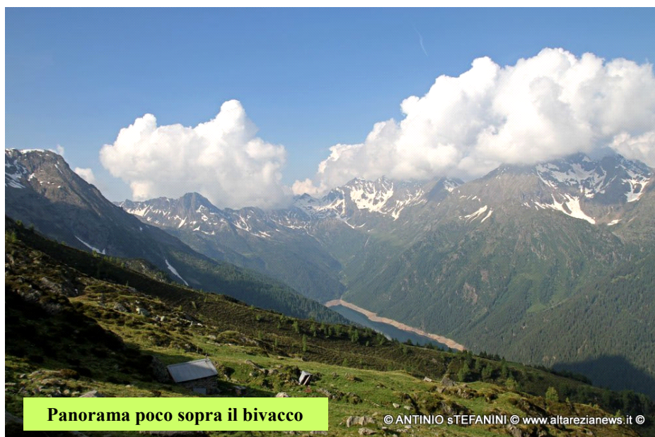
Panorama poco sopra il bivacco